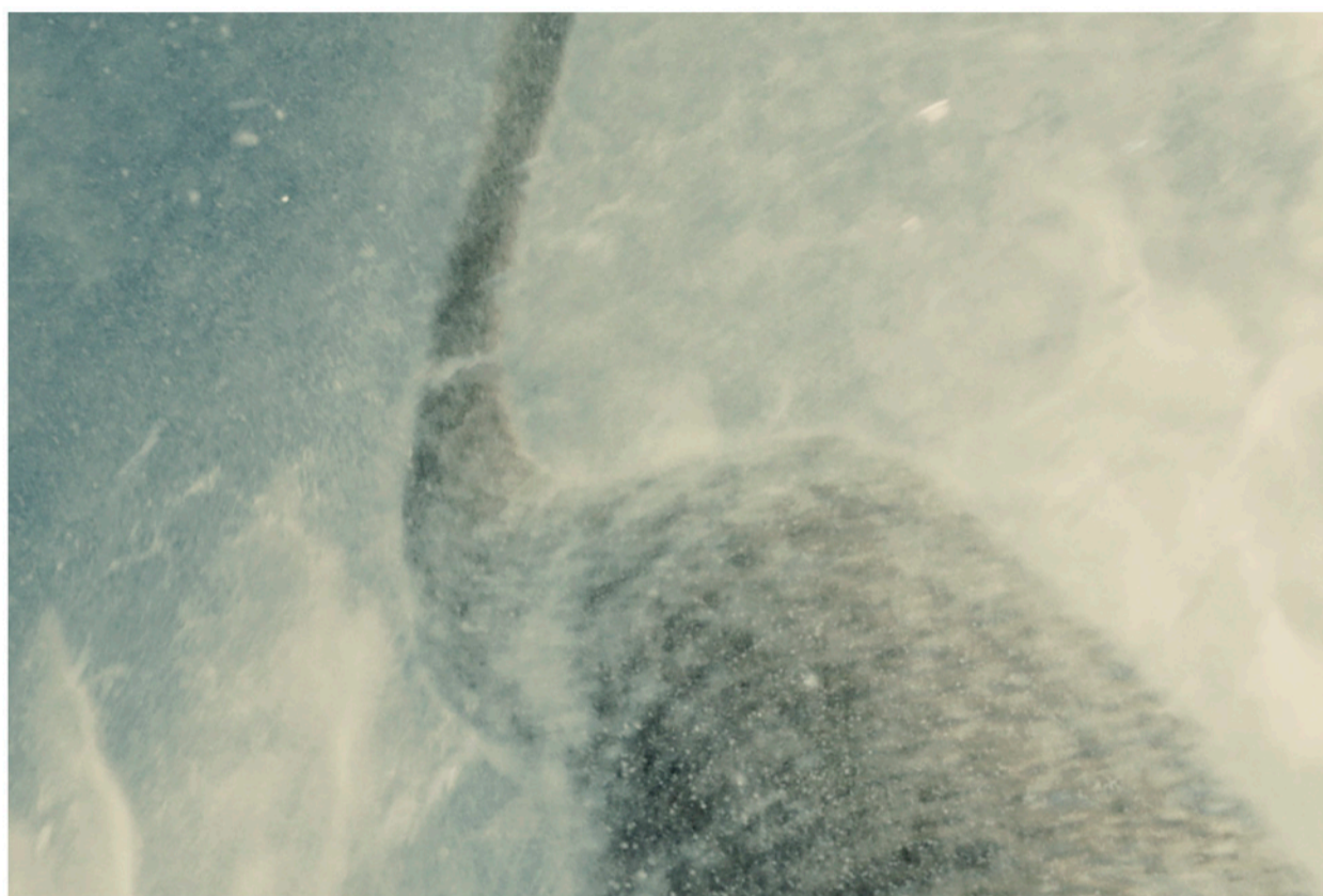
NIGODにより公開されたゴジラの写真。巨大な爬虫類の尾に酷似した形状をしている